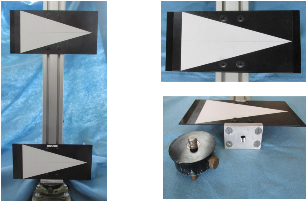
Фигура 1. Сигнална конфигурация за преминаване през широки водни препятствия

Всеки сигнал трябва да се идентифицира еднозначно, за да се избегне объркване кои сигнали са използвани и в кой момент от коя страна на препятствието са били поставени. За целта може да се използва уникален номер, буква или комбинации от тях, или да се добави цвят. Добре е уникалната идентификация да може да се види през зрителната тръба при измерване към съответния сигнал.